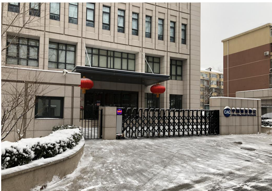
图1 中国质量协会大楼外景

特殊时期，为加强疫情防控，在正式复工之前，协会要求各部门采用电话、网络等灵活方式进行弹性工作，做好业务复盘，规划2020年度工作，对外发布了《关于弹性工作制期间外部联系业务相关事宜安排的通知》，提供各业务值班人员的联系方式，方便广大企业通过网络、电话与值班人员联系，做到业务服务不停歇。