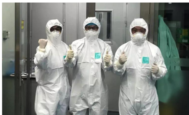
图2 金域医学积极充实武汉实验室检测能力

病毒检测工作，金域医学整合全集团资源，持续充实武汉金域实验室的一线实力，积极为武汉、天门、荆门、荆州、孝感孝南区等地承担核酸检测重任，2月10日与广东省卫健委、省疾控中心、省第二人民医院、省结核病控制中心、南方医科大学南方医院等单位组成了广东支援湖北（荆州）医疗队第一批成员，奔赴疫情前线。