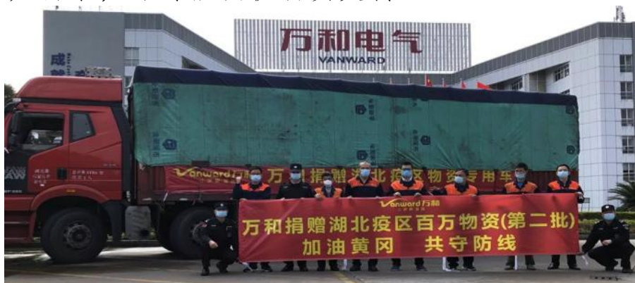
图 6 万和电气捐赠物资

广东万和新电气股份有限公司顺德总部捐赠两批物资均已顺利抵达湖北医院并投入使用，万和各销售区域及经销商积极响应疫情相关需求，尽可能提供物资支持。