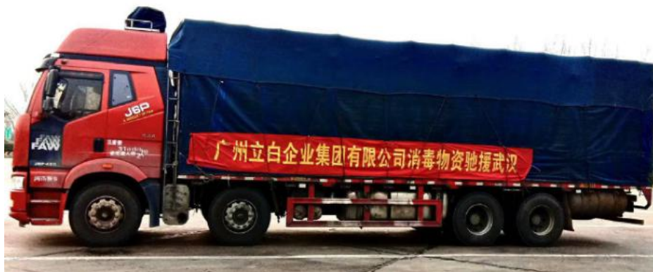
图 4 立白集团援赠消毒物资

立白集团针对抗击疫情时期消毒产品供不应求，市场、生产均告急的情况下，抓紧生产，严格把关、检查每一个环节，确保产品保质保量，同时向武汉地区援赠大量消毒物资。