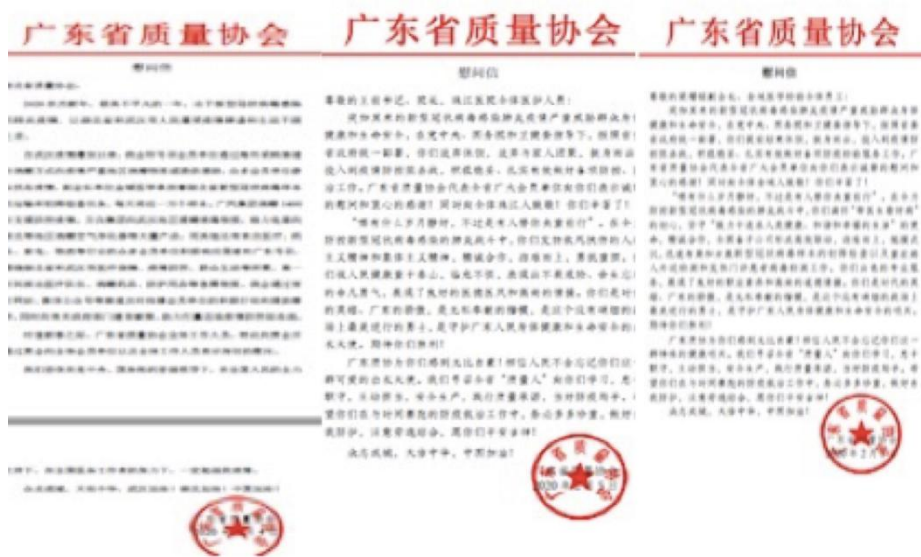
图 1 广东质协发出多封慰问信

发出了慰问信，利用协会的资源平台，积极协助扶贫地区了解联系采购口罩等医疗物资，并收集海外购买渠道信息，向会员单位发出“新型冠状病毒疫情对中小企业影响”的调查问卷，收集疫情真实的社会影响状况，通过种种方式履行社会责任。