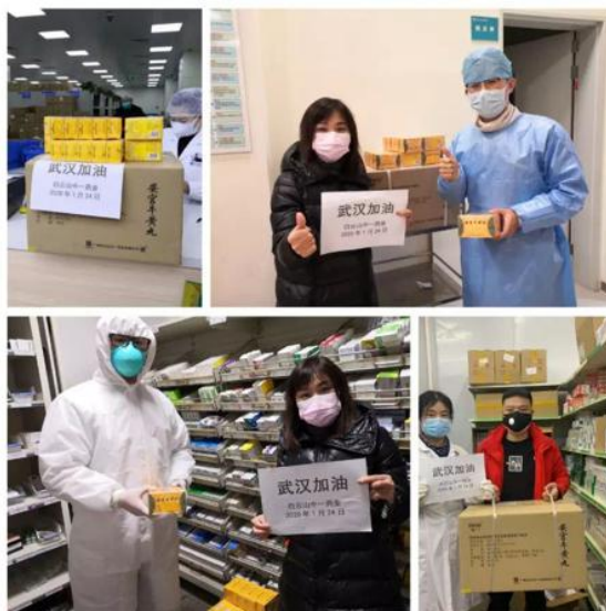
图 7 白云山中一药业捐赠药品

广州白云山中一药业有限公司第一时间向武汉捐赠药品支持武汉疫情防控 and 救治工作。