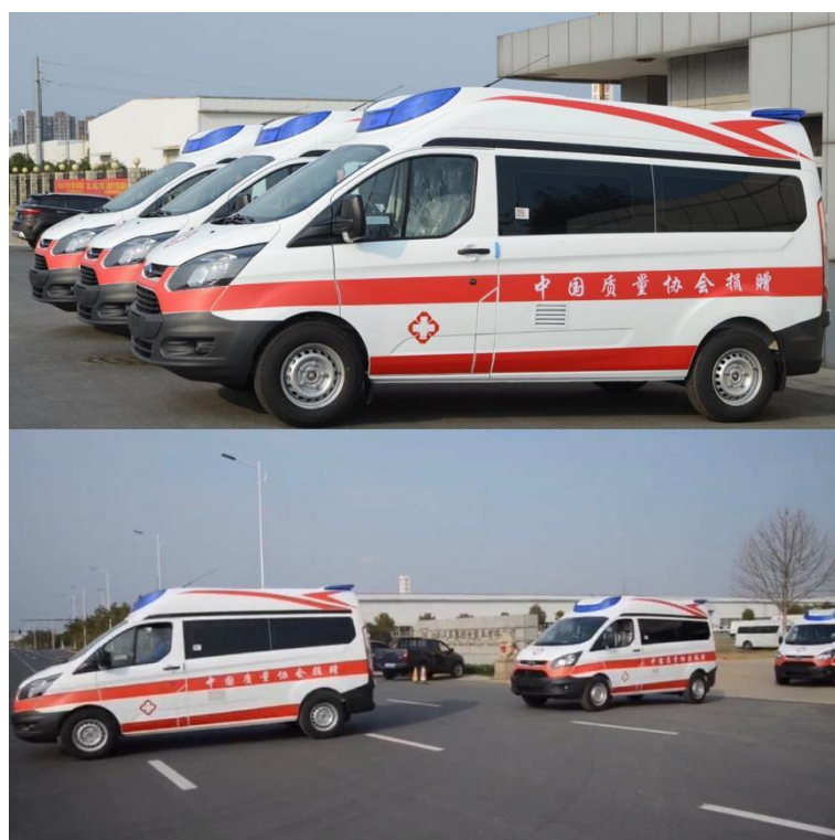
图 3 捐赠负压救护车完成测试计划赶赴湖北

中国质协向积极统筹、多方协调、克服供应紧张，全力配合协会完成捐赠事宜的企业表达了衷心的感谢。