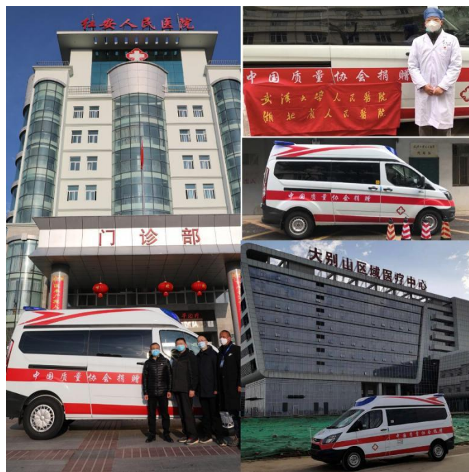
图 6 三家医院顺利接收物资

3月4日根据国资委协会党建局《关于组织党员自愿捐款支持新冠肺炎疫情防控工作的通知》精神，中国质协党委下发通知，号召广大党员踊跃捐款、奉献爱心，展现同舟共济精神风貌，为疫情防控贡献自己的一份力量。倡议发出后，协会党委领导带头捐款，各党支部党员积极响应，退休党支部的老同志、老党员也主动要求捐款，纷纷以实际行动彰显党员干部的政治自觉和社会责任。协会共有109名党员自愿捐款，所捐款项已全部转交国资委党委，用于慰问战斗在疫情防控斗争第一线的医务人员、基层干部群众、公安民警和社区工作者，支持疫情防控工作。