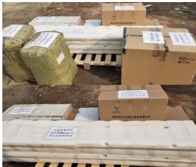
图 5 捐赠的医疗物资