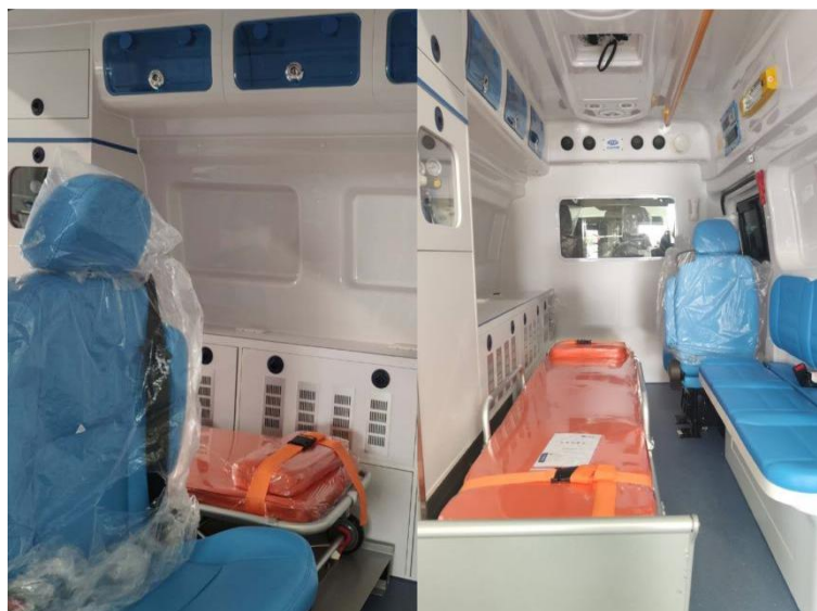
图 2 负压救护车内部