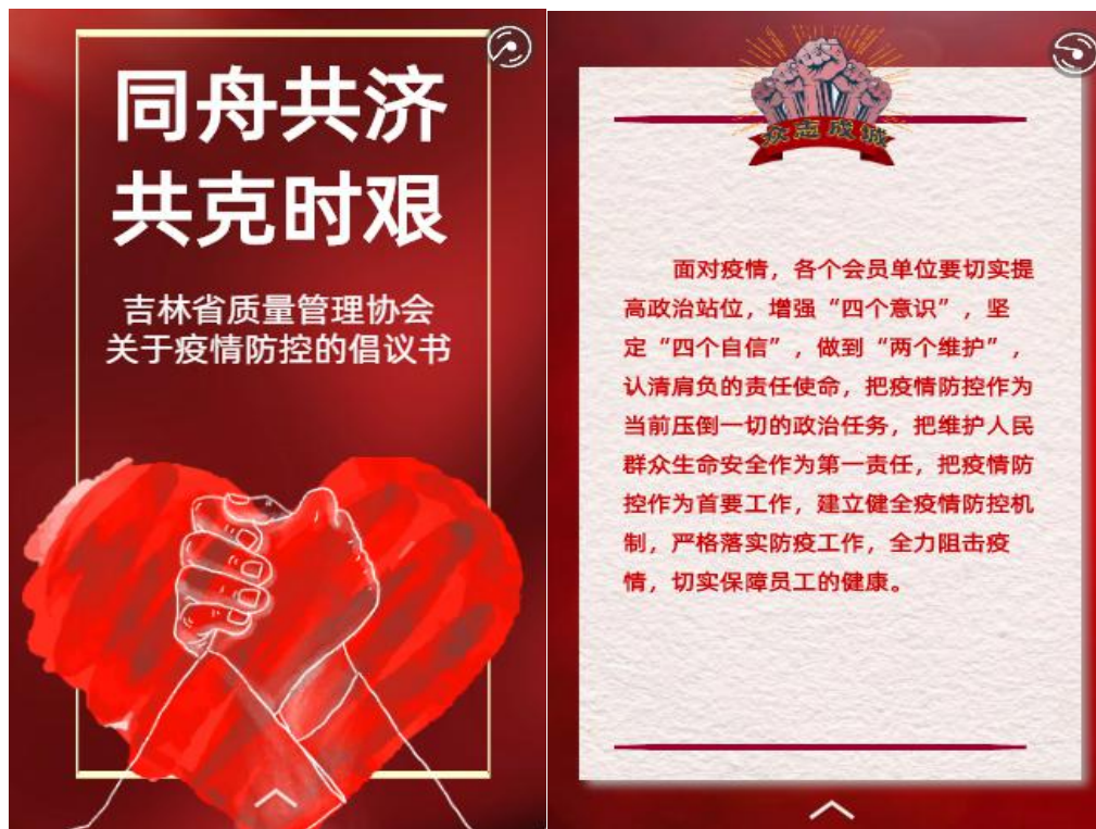
图 1 吉林质协向会员单位发出倡议

节,各会员单位牢固树立“全国一盘棋”的防控思想,守土有责、守土尽责,在做好各项防控工作的同时,有序开展工作、严格管控质量,紧密依托东北老工业基地、商品粮基地的区位优势,充分发挥各会员单位的优势与特长,主动作为、精准作为,做好交通运输、物资生产、服务保障等各项工作,以“吉林制造”助力全国防控大局,为遏制疫情扩散、维护大局稳定做出应有贡献。