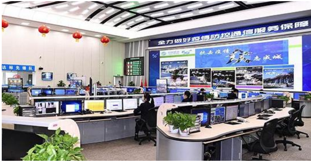
图 5 吉林移动全力做好疫情防控通信服务保障

春风已徐来，日暖将花开。在疫情防控取得显著成效的同时，吉林质协将牢记习近平总书记“高度警惕麻痹思想、厌战情绪、侥幸心理、松劲心态”这一指示，充分发挥协会作用，强化倡导、统筹力度，继续抓紧、抓实、抓细各项防控工作，与各会员单位一同努力，确保取得疫情防控阻击战的最终胜利。