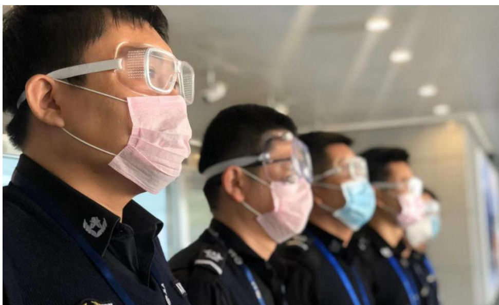
图 4 长白山机场助力疫情防控

行动、保安全运行、保应急处置、保风险可控、保精准施策。以科学应对、防疫不松、服务不减为防疫工作目标，全体员工践行爱心行动，多个班组成员放弃与家人团聚、主动上岗，更有员工为了担起疫情防控的重任，主动推迟婚期。他们用实际行动，构筑起了长白山机场地面服务到运行保障的一道“防疫墙”。