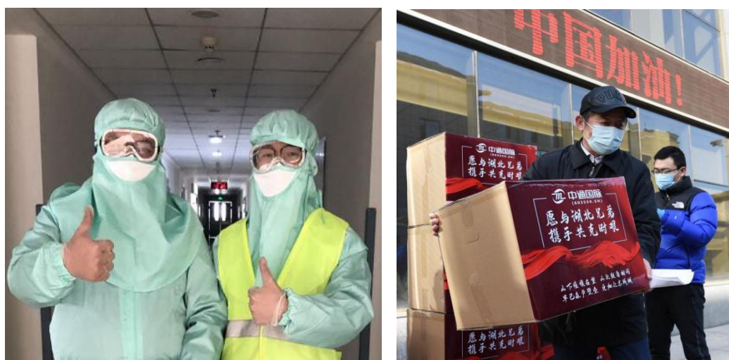
图 2 中通国脉为大连第六医院提供通信保障并向湖北援助物资

同时，中通国脉充分发扬“一方有难、八方支援”的互助精神，紧急筹措了大批口罩、防护服及方便食品等急需物资，驰援湖北，并为奋战在武汉疫情防控一线的吉林医务工作者筹集了价值近 15 万元的自助火锅、自热饭菜等食品，让吉林援鄂医疗工作者感受到家乡的支持与温暖。